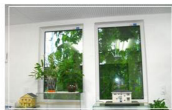
夏日陰対策のゴーヤのつるも、こんなに大きくなりました。

初めての夏を迎えます 新しいのはもちろんの事、いろんな面で快適さを感じています。 少ないエネルギーで、じめじめ感のない空気感を味わえるのは、有難いことですね。