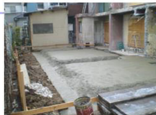
基礎工事の様子です

家を建替える予定があっても、「こんな不況に大丈夫かな」と不安に思われる方もあるかと思いますが、悪いことばかりではなさそうです。業界全体の仕事が少ないので腕利きの職人さんを指名できる、いい材料が安く手に入る、エコも含めて国や自治体からの補助金を利用できるなど…リスクもあるけれど、メリットのあるのもこの時期だからこそだと思います。