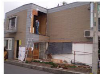
慣れ親しんできた事務所も壊されてゆきます。