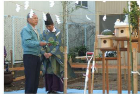
「いよいよ立ち上がるんだな」 …感慨深し