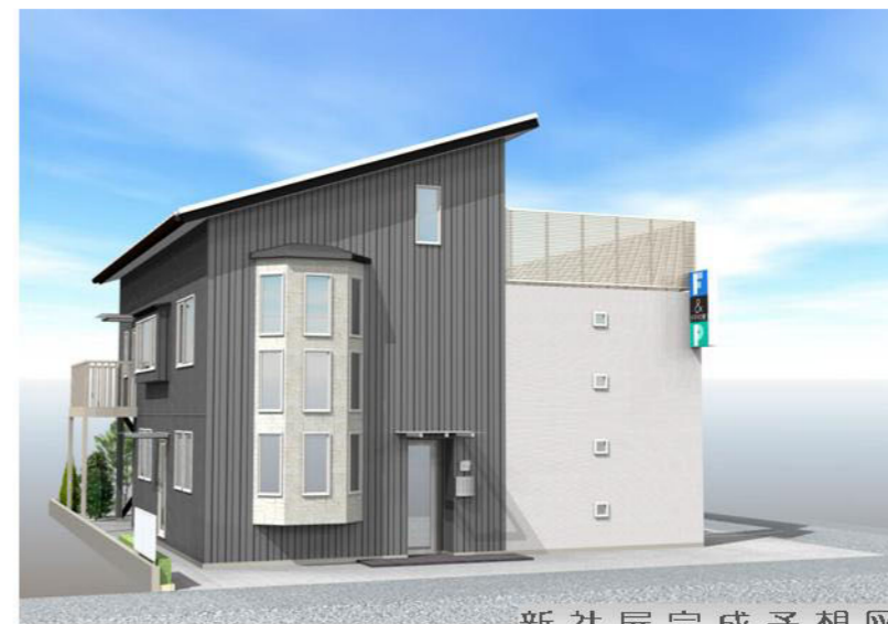
新社屋完成予想図